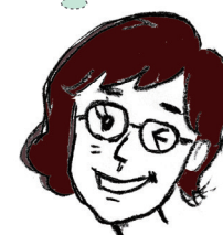
NP 認定ファシリテーター 奥さん