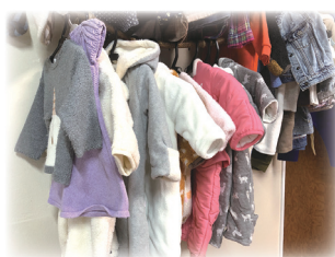
ECO サイクルコーナー 子どもの服や靴、雨具などの物々交換コーナー。