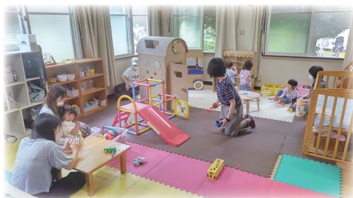
ひろばスペース 親子が自由に遊べます。昼食時間の利用もOK。

いのちやくらしを大切に考える場、おとなも子どももだれでも寄れる《だれでもひろば》として、2023年5月、まりあ幼稚園内で再スタート! ボランティアで運営しています。